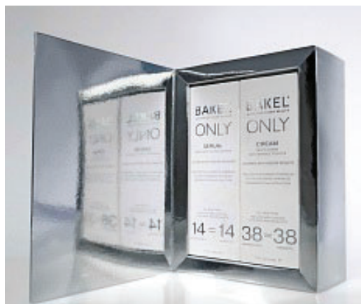
NEL SET BAKELONLY, SIERO 30 ML + CREMA 50 ML (EURO 550).

DARE I NUMERI - Un set con due referenze full size che, se usate in sinergia per 30 giorni, promettono un visibile miglioramento della grana cutanea. È la nuova combo BakelOnly di Bakel, composta da un siero formulato con 14 ingredienti clean e da una crema con 38 attivi. Per un'azione anti-età globale.