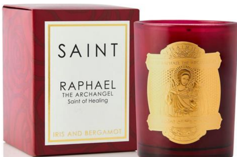
Una candela di Saint Candles dedicata all'arcangelo Raffaele

Oppure Corium, che in Campania lavora pelle rigenerata. Ampio spazio dedicato anche ai bambini, con abbigliamento e giocattoli, ma anche un'area gioco con un cagnolino robot che offre una sorta di pet therapy: il Giubileo porterà a Roma molte famiglie, ma l'idea è anche fornire servizi al vicinissimo ospedale pediatrico Bambin Gesù, come una libreria (ci sarà Mondadori), una parafarmacia, un piccolo supermercato. Inoltre, chi farà shopping a Caput Mundi potrà usufruire anche di Ethic-all, un servizio in collaborazione con la piattaforma Goodify che permette a chi fa acquisti di fare nello stesso tempo una donazione solidale.