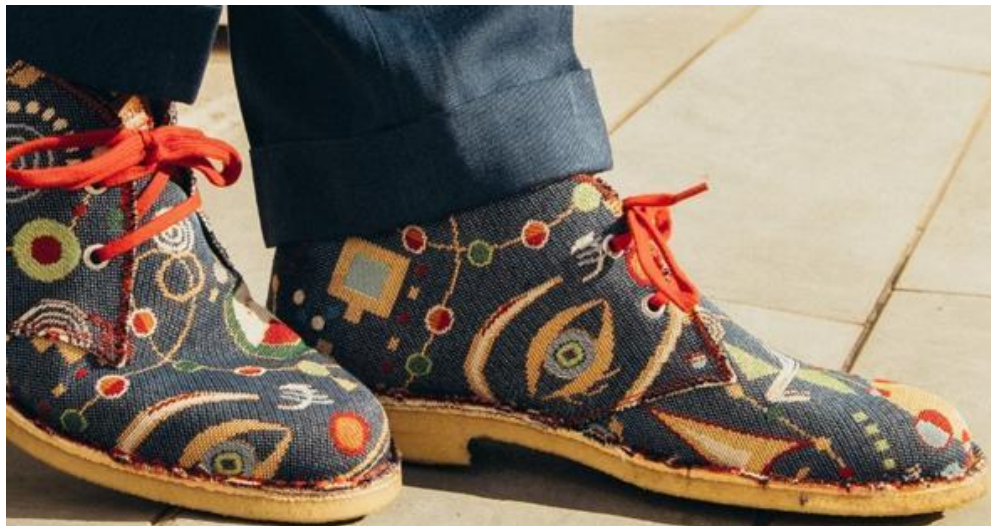
Scarpe di Canna di Bambù

Organizzato al quinto piano del Terminal Gianicolo, con una superficie complessiva di 11mila (6mila sono destinati a parcheggi e magazzini), a Caput Mundi si accederà da tre ingressi, uno direttamente su via della Conciliazione, il viale che conduce a piazza San Pietro. Al suo interno, i corner di circa 40 brand fra moda, accessori, food&wine. Alcuni sono arrivati grazie alla partnership siglata con Salotto di Brera, società attiva nei settori duty free e travel retail nel segmento lusso e che fa capo a Giglio Group. Il brand mix è accomunato da una certa attenzione a temi etici quali la sostenibilità e la solidarietà, spiegano i gestori: per esempio, il torinese Canna di Bambù, che lavora fibra di bambù con plastica riciclata da bottiglie recuperate nei mari e che collabora anche con il progetto di moda solidale Made in Carcere.