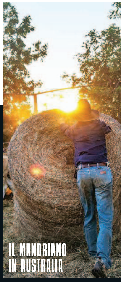
IL MANDRIANO IN AUSTRALIA

Gli esempi raccolti in queste pagine sono ottimi indizi della tendenza, già robusta sia in Italia che all'estero. Nulla è troppo strano, né esagerato o